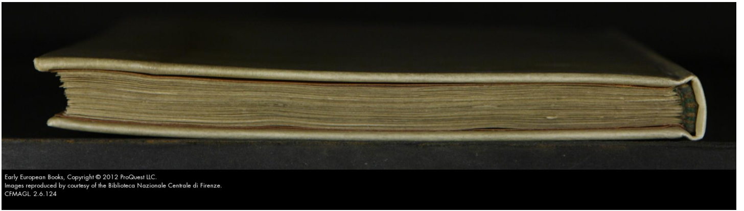
Early European Books, Copyright © 2012 ProQuest LLC. Images reproduced by courtesy of the Biblioteca Nazionale Centrale di Firenze. CFMAGL 2.6.124